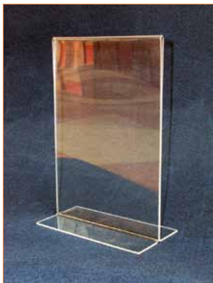
Display DIN A-4