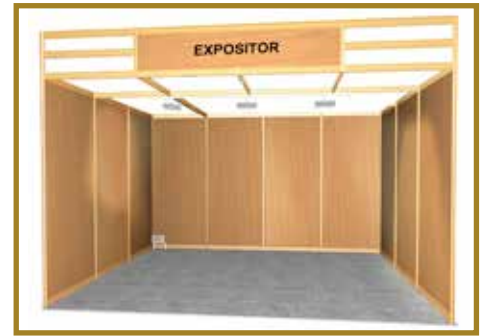
Imagen orientativa. Stand abierto a pasillos. Stand example. Open to aisles.