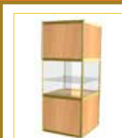
(1x1 m.) Con balda / With self (100 x 100 x 230 cm.) 215,00 €