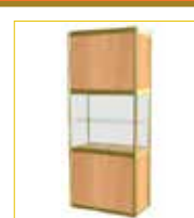
(1x0,5 m.) Con balda / With self (100 x 50 x 230 cm.) 155,00 €