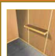
(100 x 25 cm.) 21,00 €