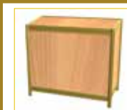
Mostrador Counter (100 x 50 x 90 cm.) 95,00 €