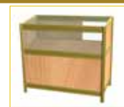
Mostrador vitrina Showcase counter (100 x 50 x 90 cm.) 135,00 €