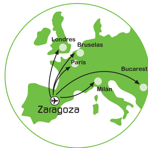
conexiones aéreas internacionales International flight connections

Simultáneamente con / Simultaneously with: