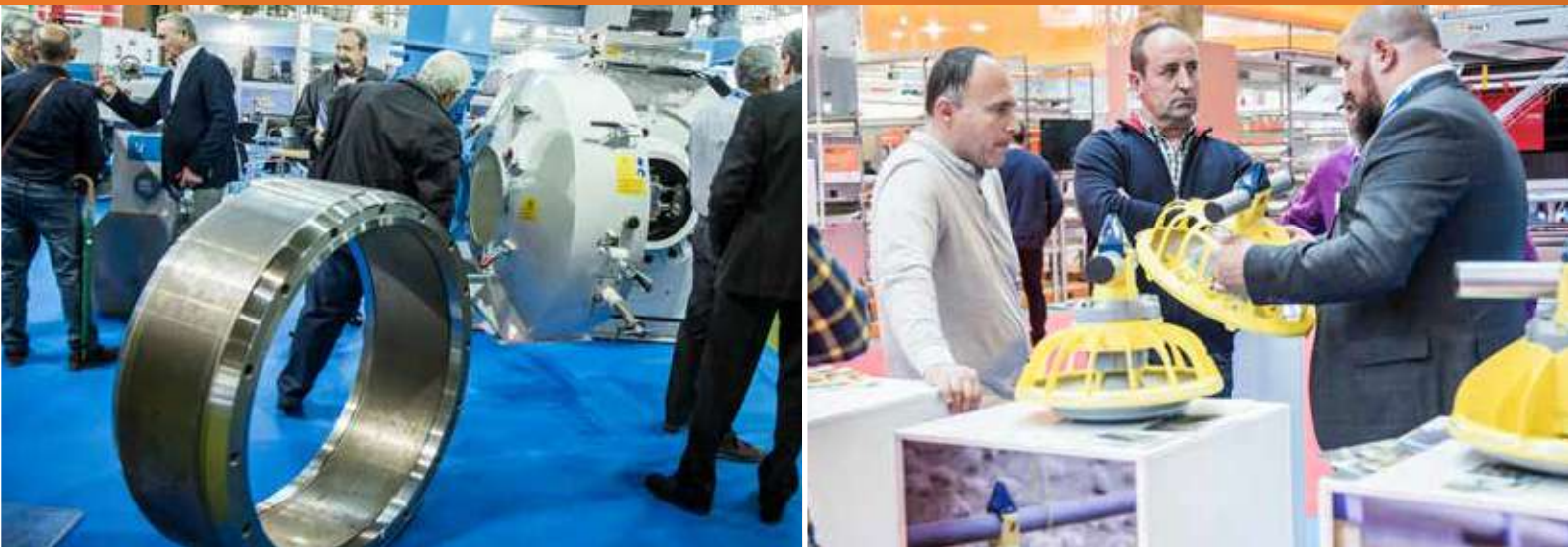
SECTORES PRESENTES EN FIGAN / EXHIBITION SECTORS OF FIGAN

The growing success showed through the previous editions, the big promotion done and Zaragoza's strategic situation, are a guarantee of a mandatory entry point in the professional breeder agendas.