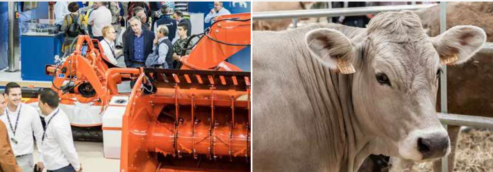
PERFIL DEL VISITANTE / VISITOR'S PROFILE

Más de 50 jornadas técnicas sumado a la importante promoción informativa y la situación logística de Zaragoza, aseguran un punto de encuentro ineludible en la agenda de los profesionales ganaderos.