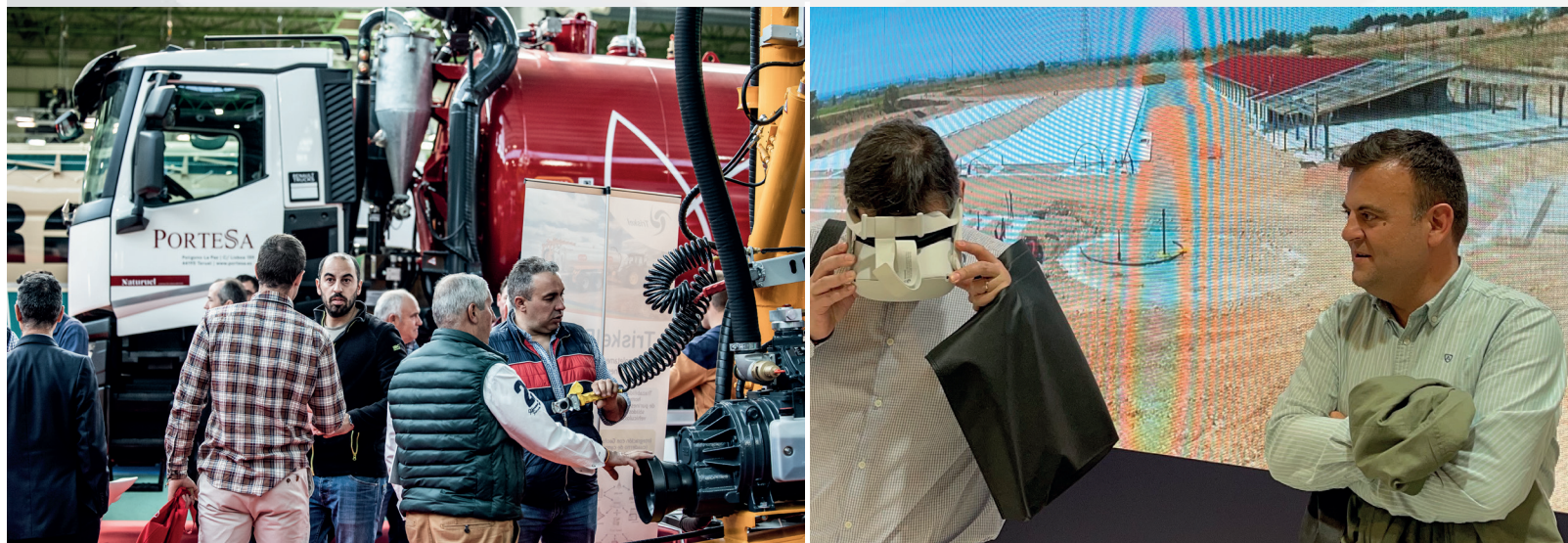
PERFIL DEL VISITANTE / VISITOR'S PROFILE

La gran oferta de jornadas técnicas, 53 en la pasada edición, además de la importante promoción informativa y la situación logística de Zaragoza, aseguran un punto de encuentro ineludible en la agenda de los profesionales ganaderos.