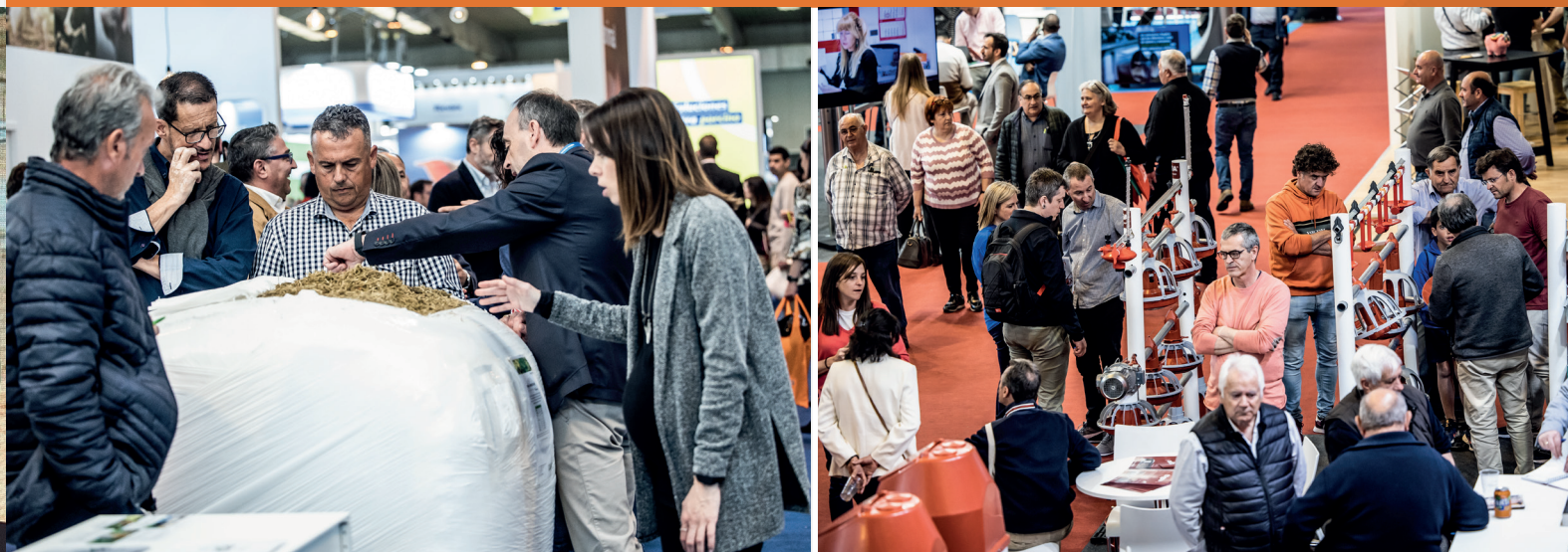
SECTORES PRESENTES EN FIGAN / EXHIBITION SECTORS OF FIGAN

The growing success showed through the previous edition, the wide range of technical conferences, 53 in the last edition, and Zaragoza's strategic situation, are a guarantee of a mandatory entry point in the professional breeder agendas.