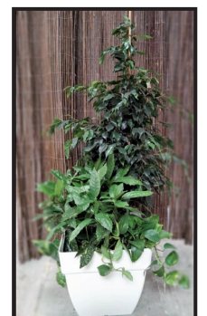
21. Macetero 42 x 42 cm. Ejemplo