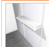
(100 x 25 cm.) 18,00 €