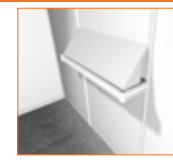
Inclinado/ Bowed (100 x 30 cm.) 27,00 €