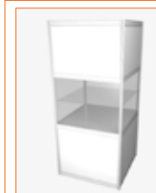
(1x1 m.) Con balda / With self (100 x 100 x 230 cm.) 205,00 €