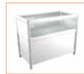
Mostrador vitrina Showcase counter (100 x 50 x 90 cm.) 115,00 €