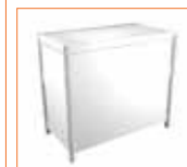
Mostrador Counter (100 x 50 x 90 cm.) 80,00 €