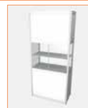
(1x0,5 m.) Con balda / With self (100 x 50 x 230 cm.) 140,00 €